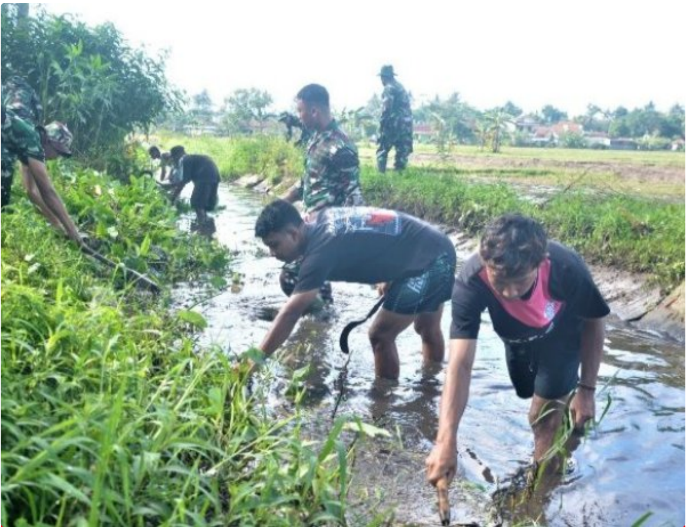
Sungai Si Rompang dibersihkan TNI Korem 071 Wijaya Kusuma